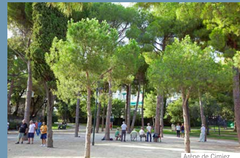
Arène de Cimiez