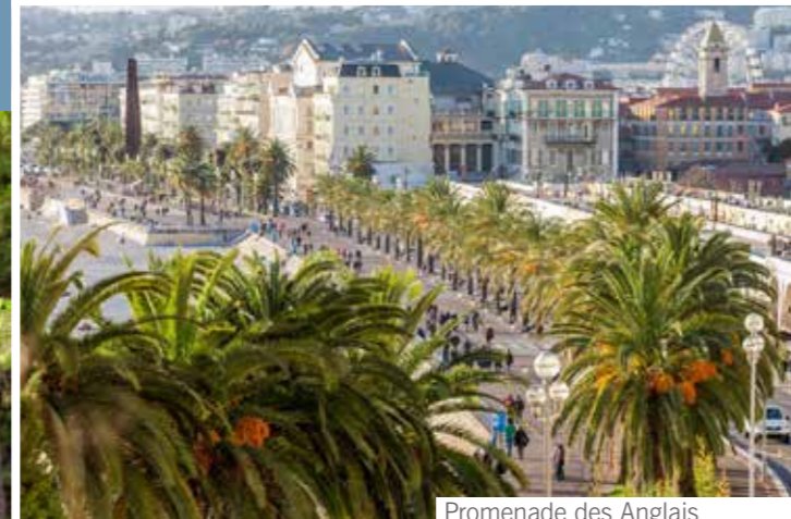
Promenade des Anglais